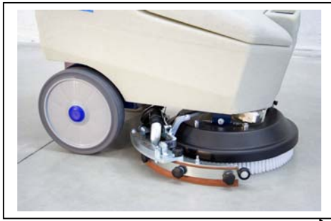
Optimale Absaugung durch schwenkbaren Saugfuß