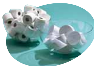
Die enSure Compact Rollen nehmen bis zu 65% weniger Platz in Anspruch.