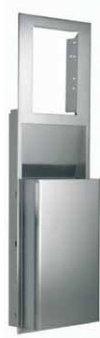
enMotion® Edelstahl Rückwand mit Papierbehälter